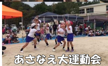
あさなえ大運動会