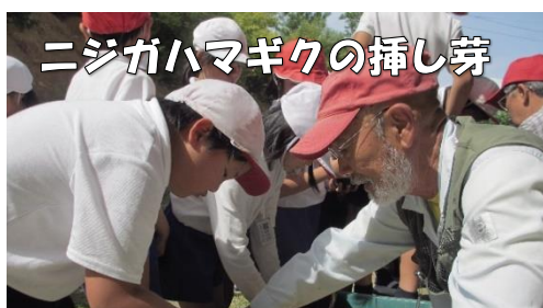
ニジガハマギクの挿し芽

浅江地区のみなさん、「コミュニティ・スクール」(コミスク)ということばを聞いたことがありますか？コミスクとは、学校・家庭・地域が「めざす子ども像」を共有し、連携・協働しながら、子どもたちの「学び」と「育ち」に積極的にかかわる『地域とともにある学校づくり』を進める仕組みです。これまで地域の方々とさまざまな取組みを行っています。