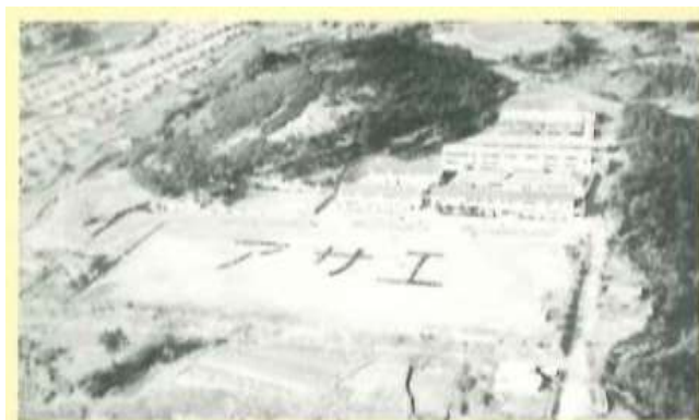
初の航空写真(昭和30年)