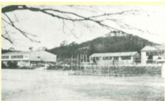
第一校舎建築着手(昭和47年)